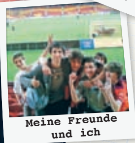
Meine Freunde und ich

I spent three months in Queensland, Australia and I wish I could have stayed longer, as this was one of the most beautiful places I have ever seen.